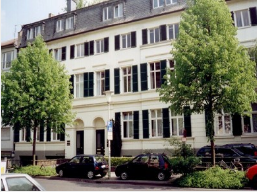
Institut für Politische Wissenschaft und Soziologie, Universität Bonn